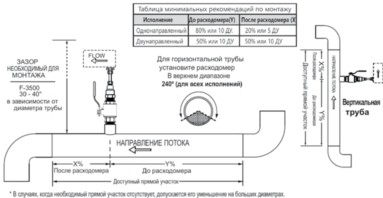
Рисунок 2 Схема монтажа электромагнитного расходомера F-3500.

К их преимуществам можно отнести: небольшие габариты и вес (не более 12 кг в полной комплектации для диаметров труб до 1800 мм); минимальное влияние на измеряемый поток; технологическую прочность; легкую установку в трубопровод с помощью стандартных монтажных комплектов, поставляемых совместно с каждым расходомером (рис. 2).