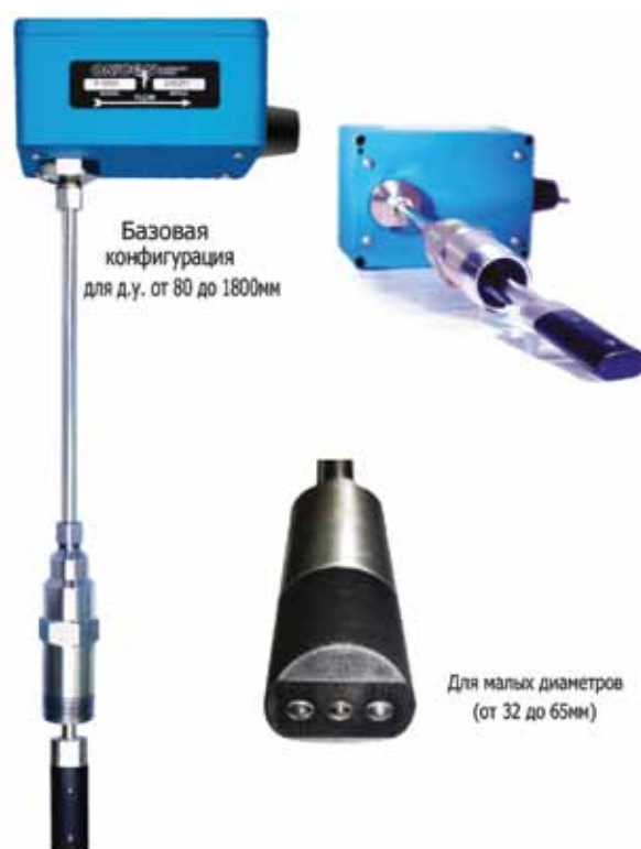
Рисунок 1 Погружные расходомеры F-3500: общий вид.

Примером такого инновационного типа приборов являются электромагнитные погружные расходомеры F-3500 (рис. 1) производства компании Onicon Incorporated (США), которые поставляются на рынок России уже более пяти лет.